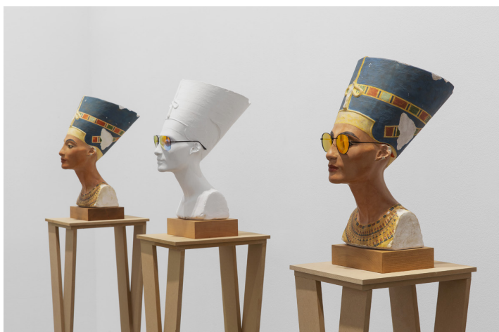
3 x Nefertiti: Dronningen av Egypt fremstår som kjølig, avmålt skjønnhet, med et lag av losangelesk utilnærmerhet i Isa Genzken's verk.