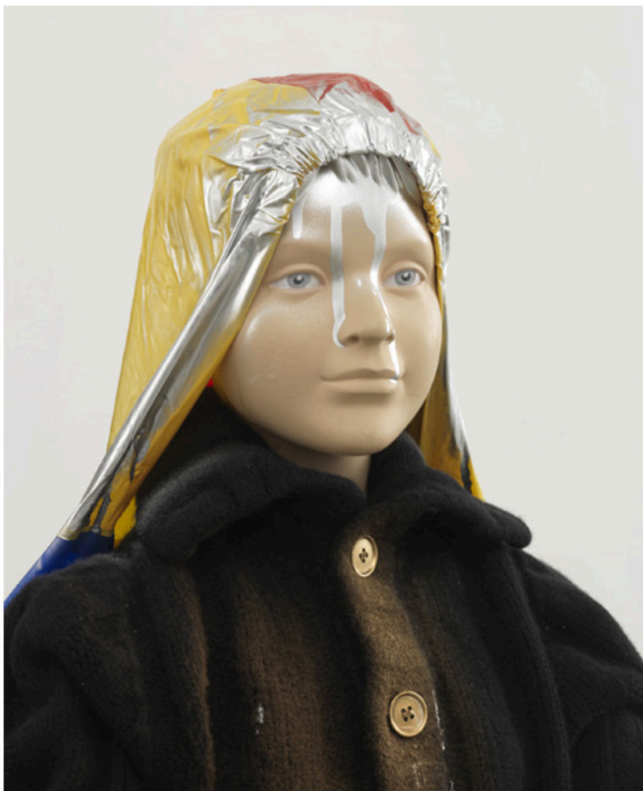
Isa Genzken, Schauspieler II, 4 (detail), 2014, mixed media, dimensions variable.