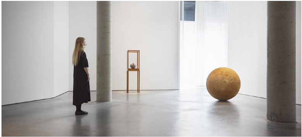
James Lee Byars: Performance i utstillingen Sphere Is a Sphere Is a Sphere Is a Sphere .