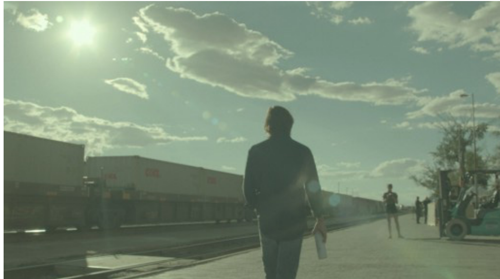
Jackson Browne dukker opp i Station to Station

om den amerikanske drømmen så tydelig som Levi's. Tidlig i filmen berøres dette amerikanske ur-temaet, reisen vestover, når fortellerstemmen, som benyttes i enkelte avsnitt, snakker om «fronten» som ikke lenger eksisterer, om hvordan toget var «sin tids internett» fordi togreisen representerte en ny standard for erfaringen av tid. Dette gjorde også at toget ble gjenstand for mye kritisk oppmerksomhet; eksempelvis var 1800-tallets berømte kunstkritiker John Ruskin svært negativ til denne teknologiske nyvinningen og mente at den beste typen reise var «en rolig gåtur langs en vei, ikke mer enn to mil per dag».