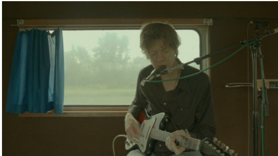
Thurston Moore gjør en innspilling på toget i Station to Station