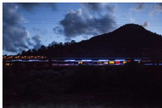
Station to Station-toget, Doug Aitkens Nomadic Light Sculpture. Foto: Alayna Van Dervort © Doug Aitken Workshop / Station to Station, LLC. Courtesy: 303 Gallery, New York og Peder Lund, Oslo.

Lysskulpturen twilight (2014), som Aitken viser på Peder Lund, er en amerikansk telefonautomat støpt i hvit, gjennomsiktig harpiks og utstyrt med bevegelsessensorer slik at publikum kan påvirke lyset. Telefonautomaten tilhører en gruppe ikoniske motiver som