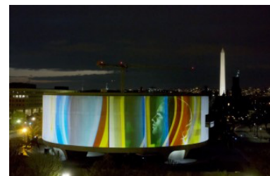
Doug Aitken, Song 1, 2012.

I Station to Station skyldes dette ikke minst at det til tider snodige materialet er såpass mangfoldig og interessant. Filmen består av 61 snutter på ett minutt. Hvert avsnitt presenterer en person, deltager eller utbroderingen av en idé knyttet til reisen. Thurston Moore fra Sonic Youth stiller både til intervju og