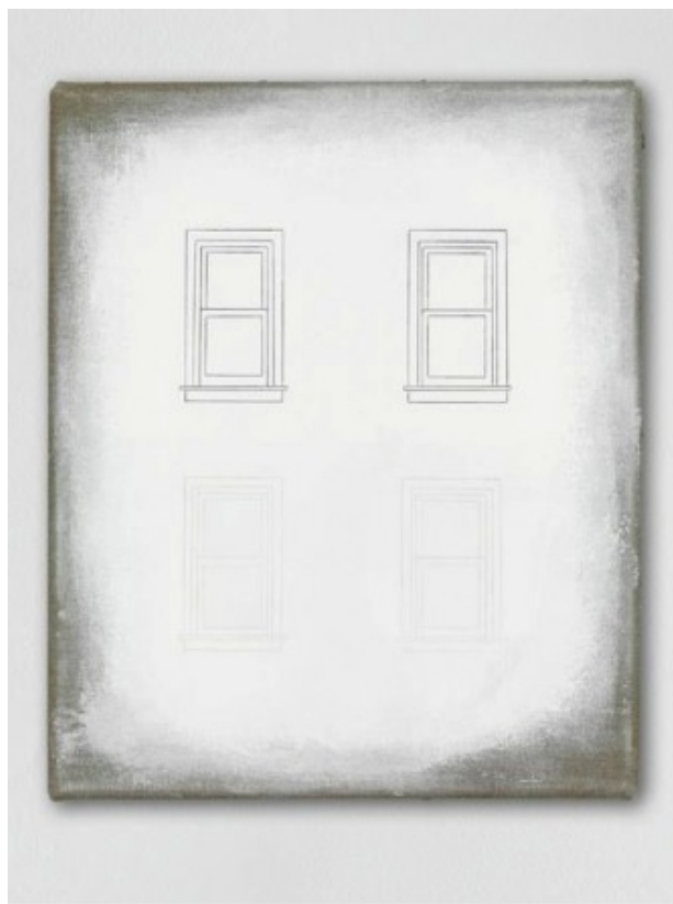
Ugo Rondinone, dreiundzwanzigsterjanuarzweitassenundelf, olje på lerret, 2011.

Foruten stillebensobjektene finnes også en serie malerier og tegninger der delvis preparerte lerreter er påtegnet vinduer. Nærmere bestemt utsikten fra et helt bestemt vindu i kunstnerens leilighet i New York som så, gradvis, blir mangfoldiggjort. Det første «maleriet» viser oss et vindu, så to, så tre, osv. Om vi betrakter verkene i forhold til tid er On Kawaras datomalerier en brukbar referanse, med tanke på måten Rondinones malerier også er indeksert ved hjelp av fotocollager fra New York Times, samt datering, på baksiden av verkene. Det finnes