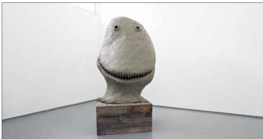
MÅNENS INNVIRKNING PÅ PSYKEN: «moonrise. east. november»