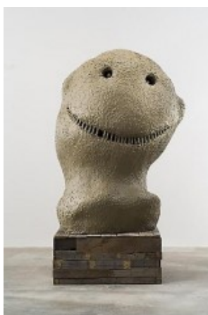
Ugo Rondinone, MOONRISE. east. march , Painted cast aluminum on steel plinth, 2005.

Ugo Rondinones har en allsidig produksjon i forskjellige medier og opererer med en rekke uttrykk. Hos Peder Lund er han i det tørre og skulpturale hjørnet, men et av de velkjente «klovnehodene» hans gliser likevel mot oss når vi kommer inn inngangspartiet som galleriet deler med Galleri Riis.